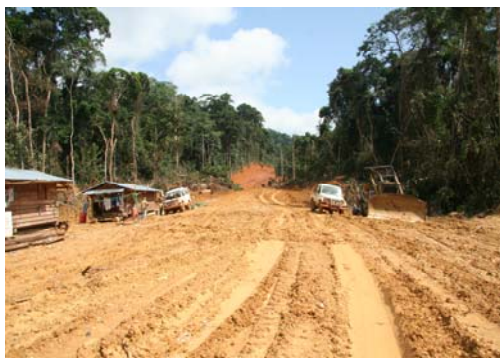
Photo 01 : Ouverture de routes au sud de la CFAD dans le bassin versant d'Ikoy