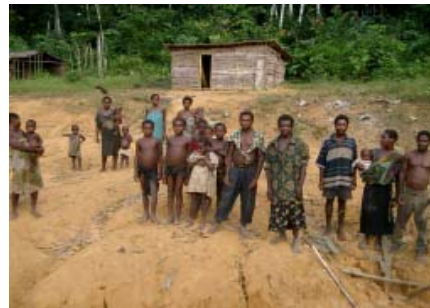
Photo 04: Pygmées Babongo de la région d'Ikobey à l'ouest de la CFAD