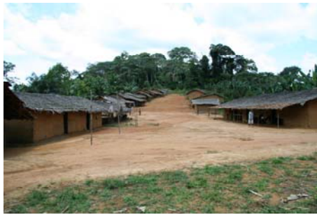
Photo 03: Vue de Makoko, village Babongo à l'intérieur de la CFAD aux abords d'Ikoy