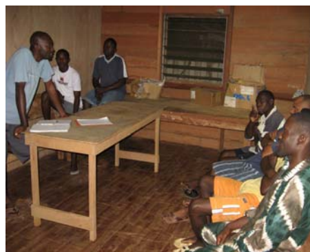
Photo 05: Réunion avec les mécaniciens, camp Mboumi, le 22/10/07, 18h30-19h50mn