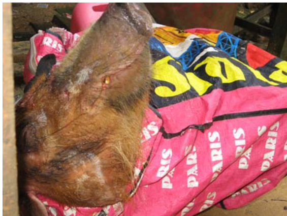
Photo 06 : Potamochoère tué au sein de la concession forestière et vendu au prix de 90.000 Frs Cfa au marché de Ndjolé.