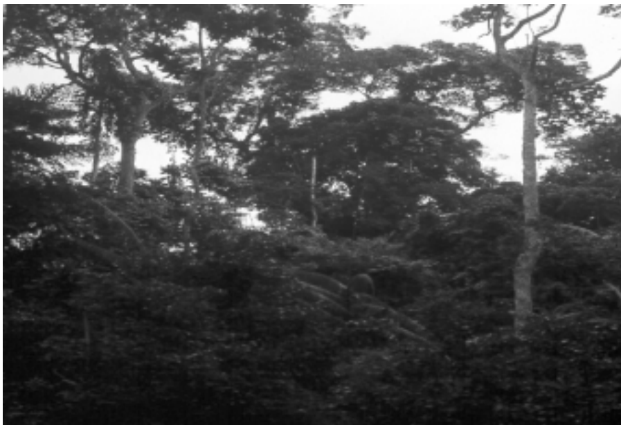
Arriver à une meilleure connaissance des forêts du Bassin du Congo par l'imagerie satellitale et des observations de terrain.

GOFc est le sigle anglais pour "Global Observation of Forest Cover" (Observatoire Mondial du Couvert Forestier). Lancé en juillet 1997, le projet est une initiative du Comité sur les Satellites d'Observation de la Terre (CEOS - Committee on Earth Observation Satellites) qui regroupe des agences spatiales, des organismes affiliés (FAO...) et des observateurs qui partagent un intérêt dans la production et l'utilisation des données d'observation de la Terre. Pour l'Afrique centrale, l'ambition du GOFc est de valoriser et de fédérer tous les efforts en la matière conduits dans la région par différents programmes de conservation et instituts de recherche, tels le PRGIE, CARPE et Landsat Pathfinder (USA), ECOFAC et TREES (UE), Global Rain Forest Mapping (Japon, USA, UE), etc. Ce que le GOFc recherche c'est la création d'un réseau de tous ces partenaires qui auraient ainsi la charge de la gestion de l'observatoire en Afrique centrale; ce qui, à terme, devrait conduire à la mise en action de synergies possibles entre le