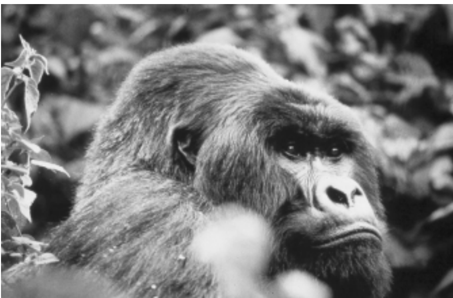
CARPE et son groupe consultatif devraient, au terme de la restructuration, parvenir à une meilleure approche des priorités en matière de conservation de la biodiversité en Afrique centrale.

Laurent SOMÉ Chargé de programme principal BSP/Africa