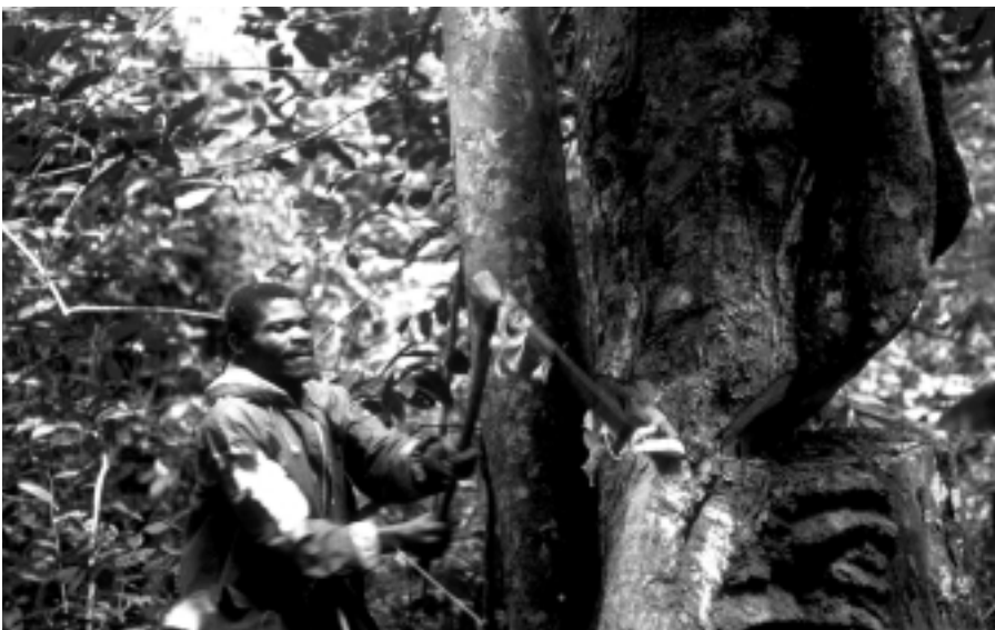
Réguler, contrôler et gérer l'accès aux ressources.

CARPE Infos souhaite un joyeux millenaire à tous ses lecteurs