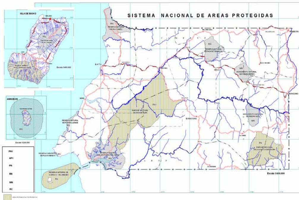
Croquis del SNAP en base a la Ley 4/2000