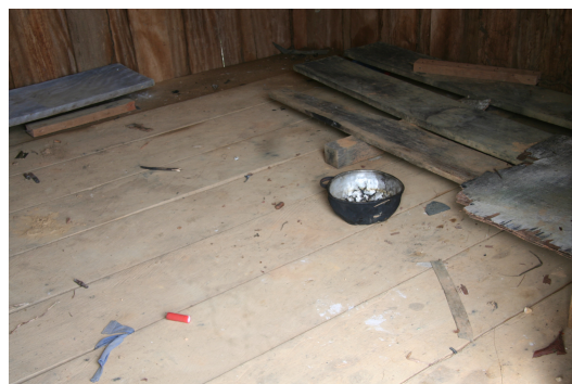
Photos 1&2: Signes de chasse (feu de camp, douille de cartouche calibre 12 et marmite) dans l'ancien camp EGG au mois de décembre 2008