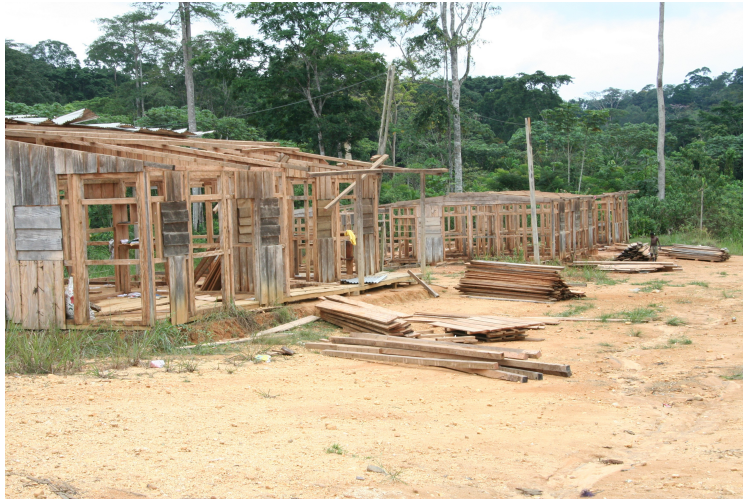
Figure 2 : Vue d'une partie du Camp démantelé en septembre 2007